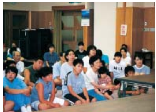
紙しばいを熱心に聞いています。

はっぴいサークル 活動報告 7月20日(木・海の日)に「はっぴいサークル」では、障害をもつたなかまといっしょに勢和村の丹生大師周辺の散策に行きました。夏の熱い太陽が照り、汗をかくほどで、皆が自然を満喫することができました。 お昼は、高齢者福祉施設ささゆり苑でとり、そのあと、ゲームや紙しばいなど、とても楽しく、夏休みのいい思い出となりました。