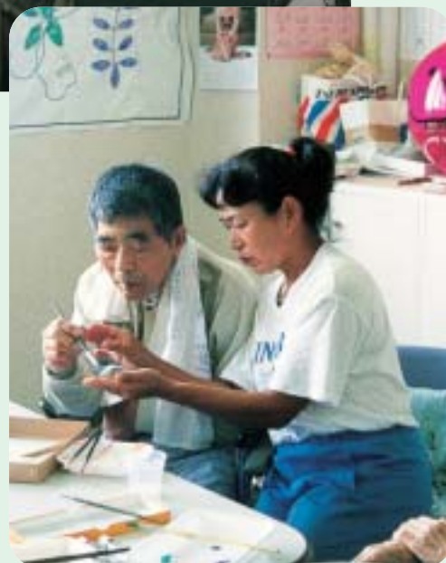
アートストーン創作に熱中