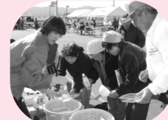
分別にご協力ありがとうございました