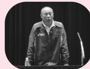
平岡氏による講演

体験・参加コーナーもにぎわいをみせ、笑顔と笑顔をつなぐふれあいの大会となりました。