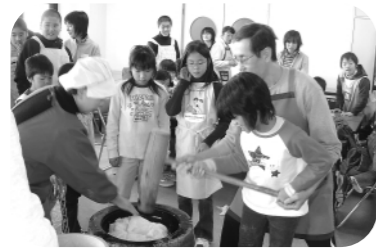
みんなでついて食べるお餅はおいしいね