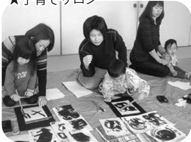
書き初め(カラフルらいおん)