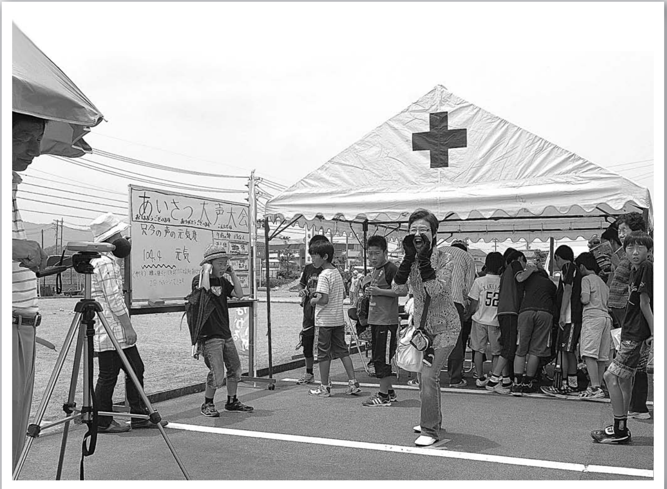
▲保健福祉会館の中心で「あいさつの言葉」を叫ぶ