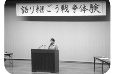
「語り継ごう戦争体験」発表(遺族会)