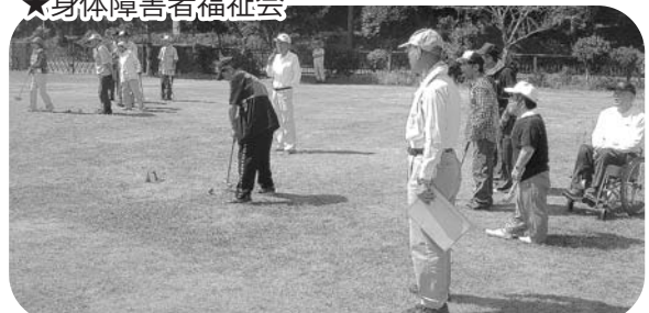
楽しく集うグラウンドゴルフ大会(身体障害者福祉会)