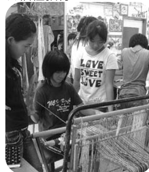
夢工房たまきでさおり織体験 (小学生福祉体験教室)